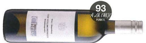
Weingut Christ, Wien 2016 Weißburgunder „Der Vollmondwein“, 13%, DV

Helle Farbe, nuanciertes, komplexes Bukett, Nektarine, grüner Apfel, Kumquat, am Gaumen gehaltvoller Wein, kandierte Fruchtnoten und balancierter Trinkfluss, gute Länge, Mandeln und Grapefruit im Rückaroma