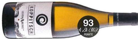
Weingut Koppitsch, Neusiedl am See

2015 Neuburger Leithaberg DAC, 13,5%, NK